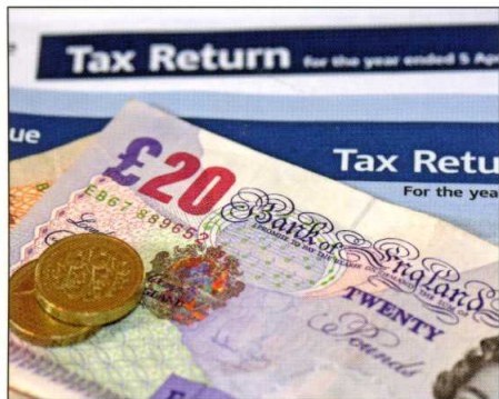
FISCALITÉ La Suisse est-elle un paradis fiscal?