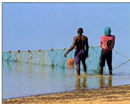
MICROFINANCE Classe d'actif anti-pauvreté!