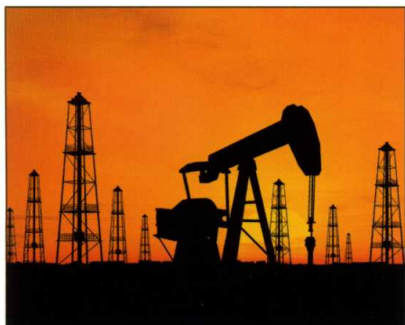
MATIÈRES PREMIÈRES Un marché sous haute pression